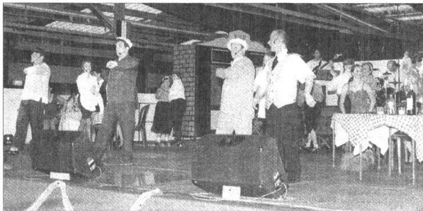
La troupe "Dance and sing" a accueilli les "Danses de jadis" sur scène

Près de trois cents personnes ont été enchantées par le dynamisme des interprètes et la musique de l'époque. Le spectacle s'est prolongé par un bal animé par la troupe.